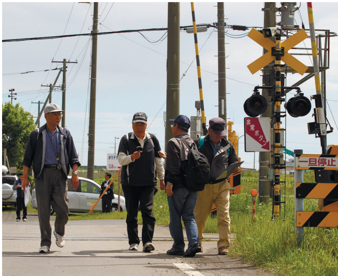
JR根室線の踏切南側で車から降り、徒歩でさらに先の避難場所へ向かう訓練参加者＝釧路市大楽毛地区

インターネットで道新ニュース www.hokkaido-np.co.jp ご購入申し込みは 0120-464-104