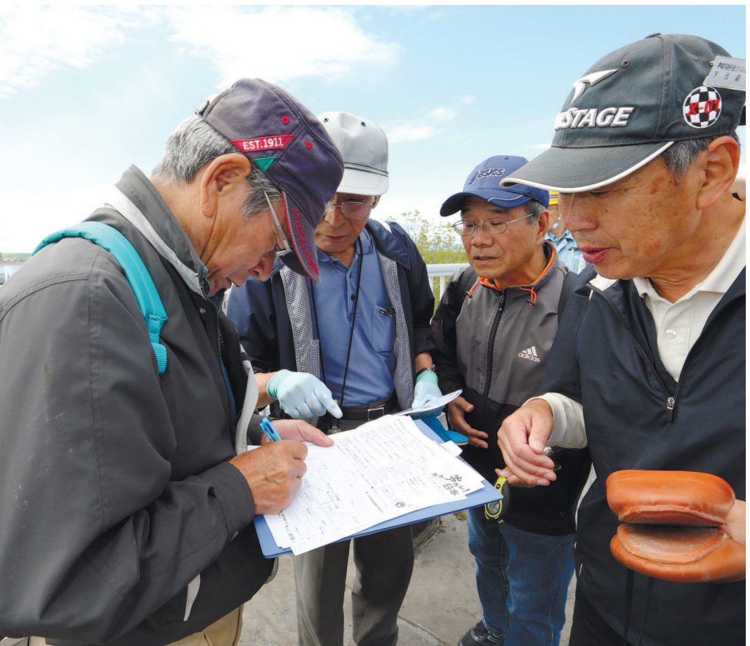
避難先の王子マテリア釧路工場の独身寮で、避難者名簿に名前などを書き入れる人たち＝同

前後で目標地点に到着。残り1グループは徒歩で鶴野支援学校付近を目指し、30分ぎりぎり到着した。参加者のうち7人は、訓練後に同工場内の王子クラブで開かれた津波防災ワークショップ(体験集会)「むすび塾」に参加。訓練で浮かび上がった課題などを話し合った。